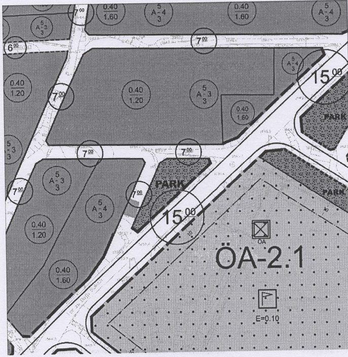
Şekil 4: 1/1000 Ölçekli Mevcut Uygulama İmar Planı

Sivas İli Suşehri İlçesi Yalnızbağlar Mahallesi 603 ada 50 nolu parselin güneyinde kalan park alanında mevcut Uygulama İmar Planında bölgeye enerji ihtiyacını karşılayacak bir planlama çalışması yapılmamıştır.