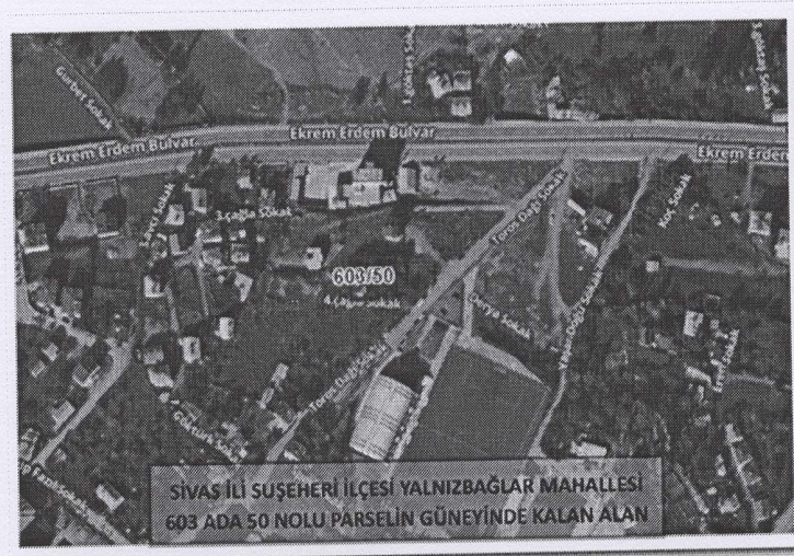
Şekil 3. Çalışma Alanı Parsel Durumu

Sivas İli Suşehri İlçesi Yalnızbağlar Mahallesi 603 ada 50 nolu parselin güneyinde kalan park alanına denk gelmektedir.